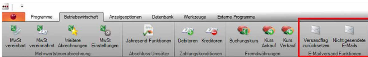
↑ Beispiel Ribbon