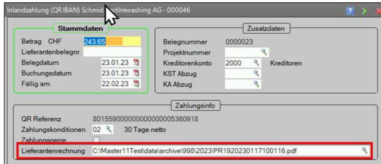
← Beispiel Abbildung Kreditoren PDF-Ablage