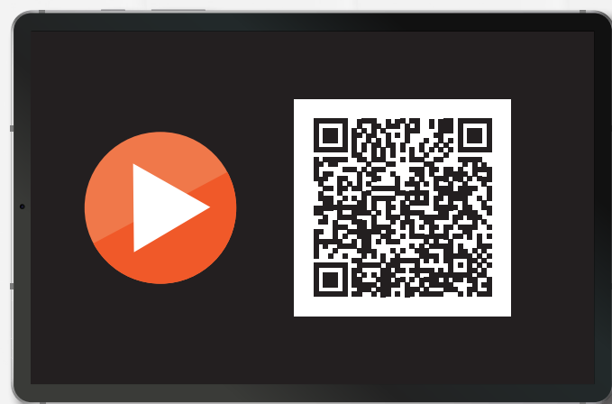
Tableau für europa3000™ ERP Daten sichtbar machen

Öffnen Sie zugeordnete PDF-Dateien – von Buchungssätzen in der Finanzbuchhaltung bis zu Rechnungen oder Vergütungsaufträgen – mit einem Klick direkt in allen Modulen von europa3000™. Nahtlos integriert. Übersichtlich. Effizient.