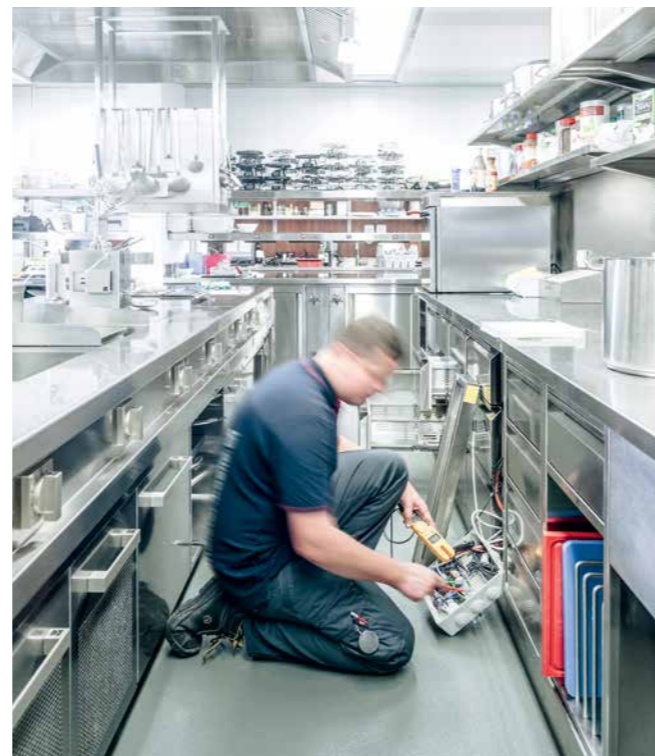
Abb: Störungsbehebung in einer Gastroküche

die Funktionstüchtigkeit, Sicherheit, Energieeffizienz und die Lebensdauer von Anlagen. Bei Klimageräten steht insbesondere die Funktion und der hygienische Aspekt im Vordergrund.